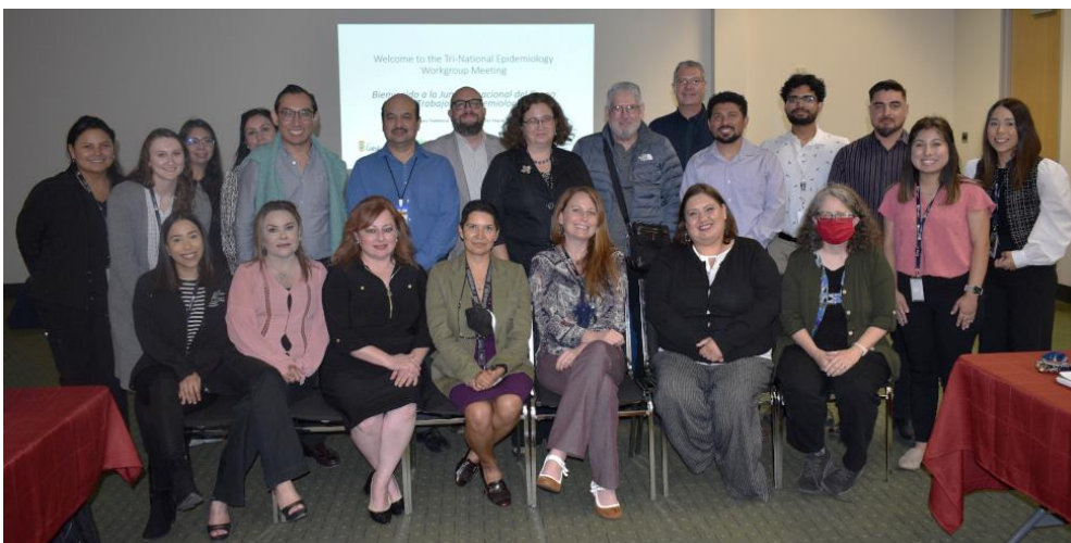
Tri-National Epidemiology Workgroup meeting in Eagle Pass, Texas, on October 11, 2022. It was the first in person since December 2019

Las condiciones elegidas para intercambiar datos son VIH, tuberculosis, tosferina, dengue y brotes o enfermedades inusuales. La formación del grupo ha ayudado a reforzar la comunicación entre las contrapartes de Coahuila y la TTKT. También ha ayudado a desarrollar una manera más sistemática de compartir información entre países.